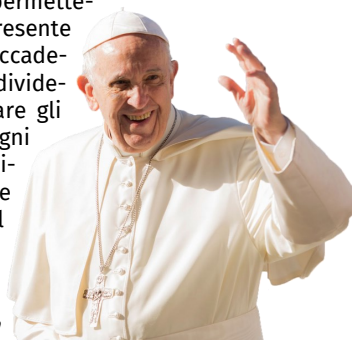
Papa Francesco in Ungheria, 6 maggio 2019

Per venire qui (...), avete fatto una lunga strada. I vostri sacerdoti e catechisti, che hanno seguito il vostro percorso di catechesi, vi hanno accompagnato anche nella strada che vi porta oggi a incontrare Gesù e a riceverlo nel vostro cuore. Egli, come abbiamo ascoltato nel Vangelo (cfr Gv 6,1-15), un giorno ha moltiplicato miracolosamente cinque pani e due pesci, saziando la fame della folla che lo aveva seguito e ascoltato. Vi siete accorti di come è incominciato il miracolo? Dalle mani di un bambino che ha portato quello che aveva: cinque pani e due pesci (cfr Gv 6,9). Allo stesso modo in cui voi oggi aiutete il compiersi del miracolo di far ricordare a tutti noi grandi qui presenti il primo incontro che abbiamo avuto con Gesù nell'Eucaristia e poter ringraziare per quel giorno. Oggi ci permettete di essere nuovamente in festa e celebrare Gesù che è presente nel Pane della Vita. Perché ci sono miracoli che possono accadere solo se abbiamo un cuore come il vostro, capace di condividere, di sognare, di ringraziare, di avere fiducia e di onorare gli altri. Fare la Prima Comunione significa voler essere ogni giorno più uniti a Gesù, crescere nell'amicizia con Lui e desiderare che anche altri possano godere la gioia che ci vuole donare. Il Signore ha bisogno di voi per poter realizzare il miracolo di raggiungere con la sua gioia molti dei vostri amici e familiari.