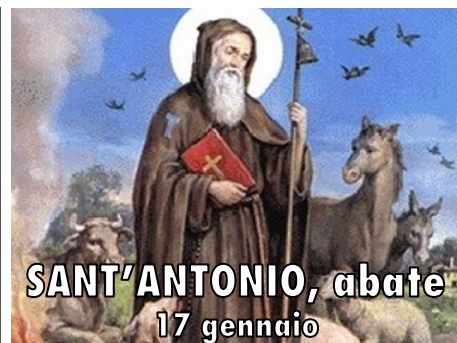
SANT'ANTONIO, abate 17 gennaio

Nel 2008 viene celebrato solennemente, in tutto il mondo, con vari eventi, il primo centenario della Settimana di preghiera, il cui tema «Pregate continuamente!» (1Ts 5,17) manifestava la gioia per i cento anni di comune preghiera e per i risultati raggiunti.